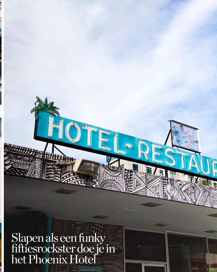
Slapen als een funky fiftiesrockster doe je in het Phoenix Hotel