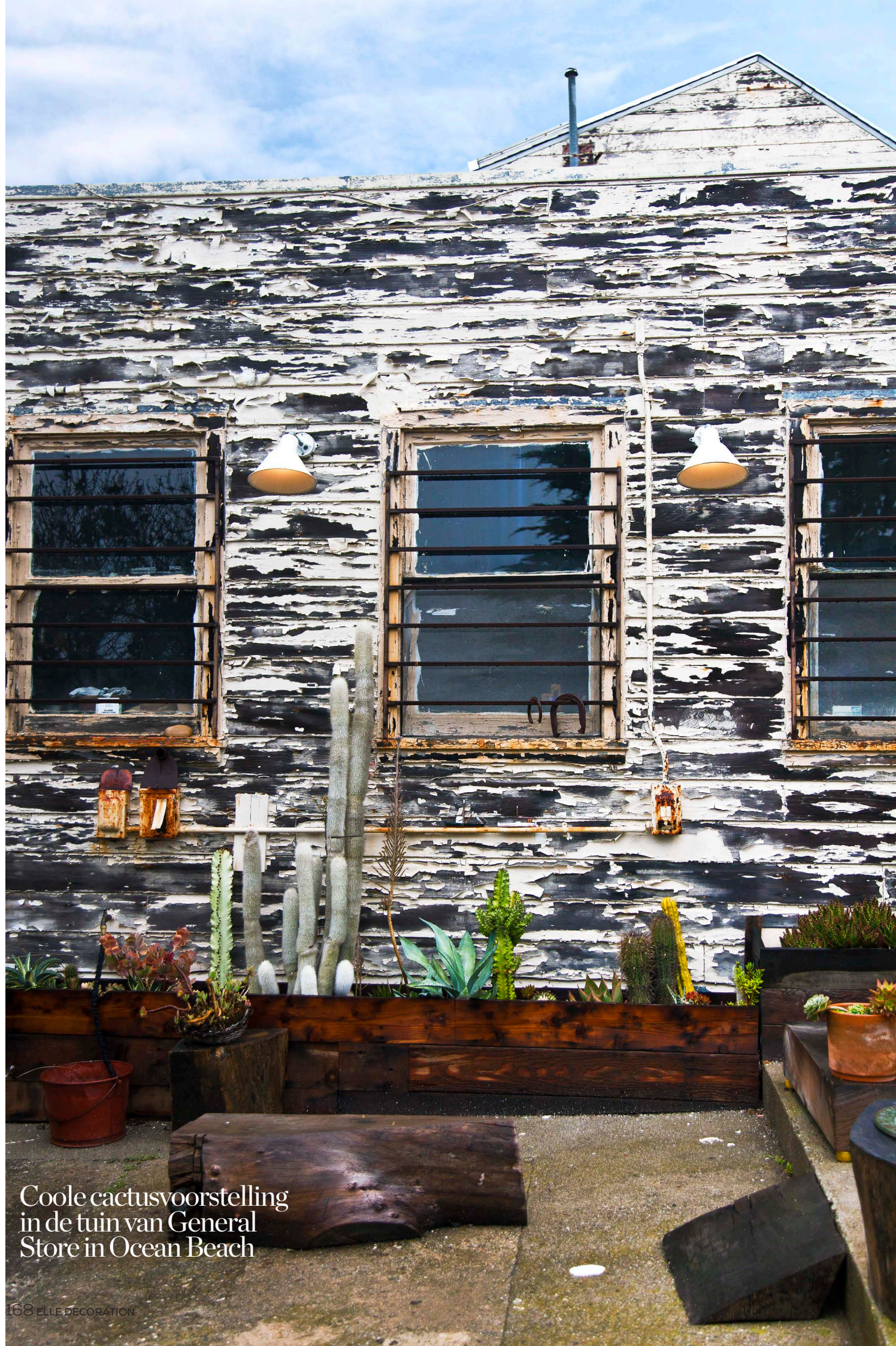
Coole cactusvoorstelling in de tuin van General Store in Ocean Beach

Ga op zondag vooral op excursie buiten de stad. Neem de indrukwekkende Golden Gate Bridge en rijd door het prachtige landschap met kronkelige, steile wegen. Bestemming is een van de mooiste en ruigste kustgebieden, tevens de thuishaven van de Tomales Bay Oyster Company (Highway 1, Tomales Bay), een geweldige oesterspot aan de baai, hoewel het eigenlijk een veredelde snackbar is. Bestel er de chowder en vervolgens een mix van oesters: rauw, op de bbq gegrild, met blauwe kaas, met chorizo... Een fles witte wijn erbij en het leven is goed.