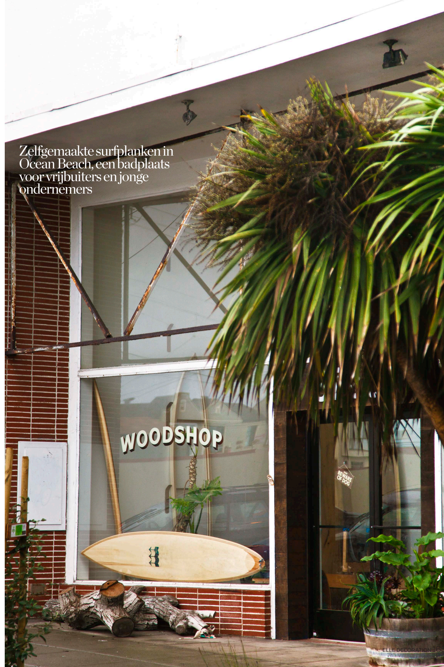
Zelfgemaakte surfplanken in Ocean Beach, een badplaats voor vrijbuiters en jonge ondernemers

Outer Sunset/Ocean Beach vind je ten westen van het centrum. Het is een buzzy badplaats vol vrijbuiters en surfers. Het schijnt hier volgens de locals de laatste jaren wel mee te vallen met de beruchte ochtendmist, waardoor de plek steeds populairder wordt. Daar komt bij dat de huren hier nog redelijk zijn – San Francisco is behoorlijk duur – en dus zie je dat ook hier jonge ondernemers hun winkeltjes en restaurants beginnen. Zo is er Woodshop (3725 Noriega Street), waar vier ambachtsslieden werken. Josh Dutie (op de foto) is model, meubelmaker en meester in het renoveren en upcyclen van interessant tweedehands meubilair. Hij heeft een grote voorkeur voor stoelen. Ook tof zijn de zelfgemaakte surfplanken van fanatiek surfer Danny Hess. woodshopsf.com